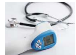
Medical Equipment / Équipement médical