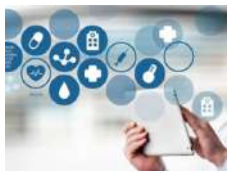
IT Systems & Solutions / Systèmes et solutions informatiques