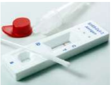
Diagnostic Kits / Trousse de diagnostic