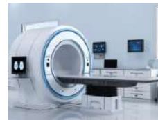
Imaging & Diagnostics / Imagerie et diagnostic