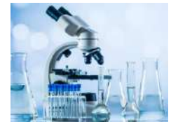
Laboratory Equipment / Équipement de laboratoire