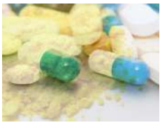
API's / Ingrédients pharma actifs