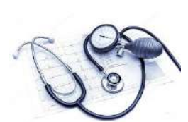
Others / Autres