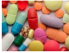
FDF's / Forme posologique finie