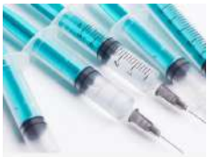
Consumables & Disposables / Consommables et jetables