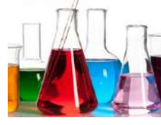
Intermediates & Specialty / Intermédiaires & Spécialisés