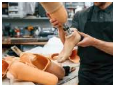
Orthopaedic Technology / Technologie orthopédique