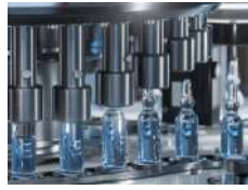
Pharma Machinery / Machines et équipements pharma