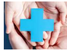
Medical Services / Services médicaux