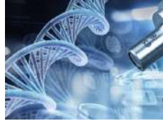
Bio Pharmaceuticals / Produits pharmaceutiques