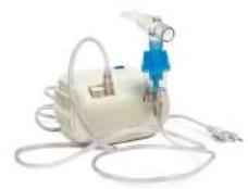
Drug Delivery Devices / Dispositifs d'administration de médicaments