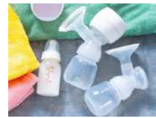
Pédiatrie / Pediatrics