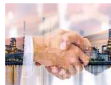
Contract Manufacturing / Fabrication sous contrat