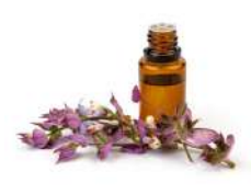
Natural Extracts / Extraits Naturels