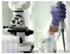
Analytical & Lab Services / Services d'analyse et de laboratoire